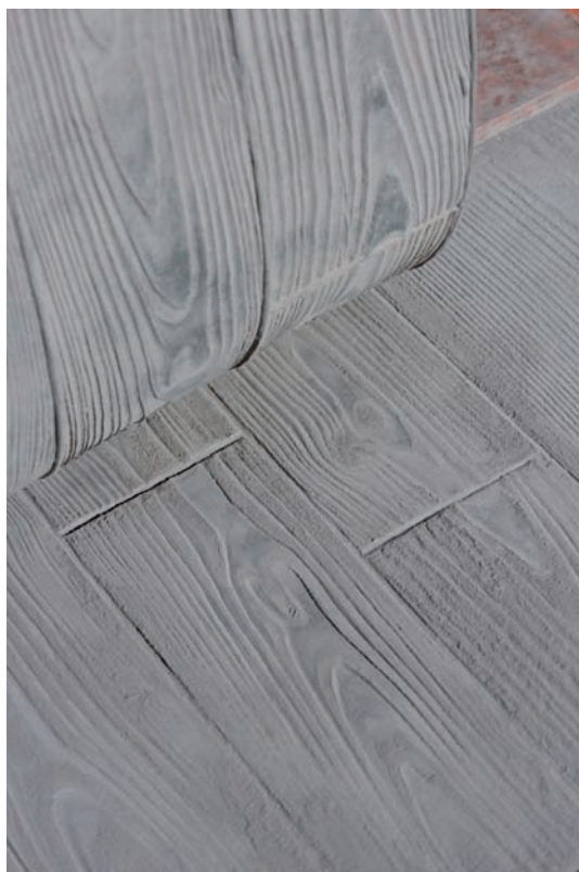
Le béton empreinte reproduit à la perfection une multitude de formes et de décors, tels que le bois, ci-dessus, un matériau naturel de plus en vogue en aménagement extérieur.

Doté de nombreux atouts, ce revêtement décoratif convient tout particulièrement aux surfaces à fortes sollicitations, grâce à une résistance incomparable et un entretien minimum.