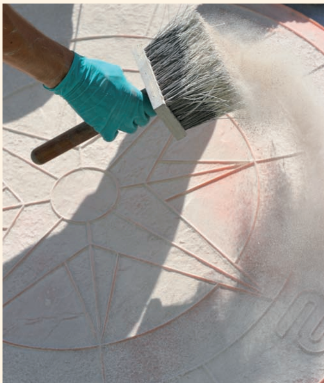
Nécessitant un savoir-faire technique pointu, facile à acquérir grâce aux stages de formation proposés par Unibéton en partenariat avec Moderne Méthode, le béton empreinte requiert rigueur et minutie à chaque étape de la mise en œuvre. L'application des agents de démoulage, ci-dessus, demande une gestuelle précise et maîtrisée.